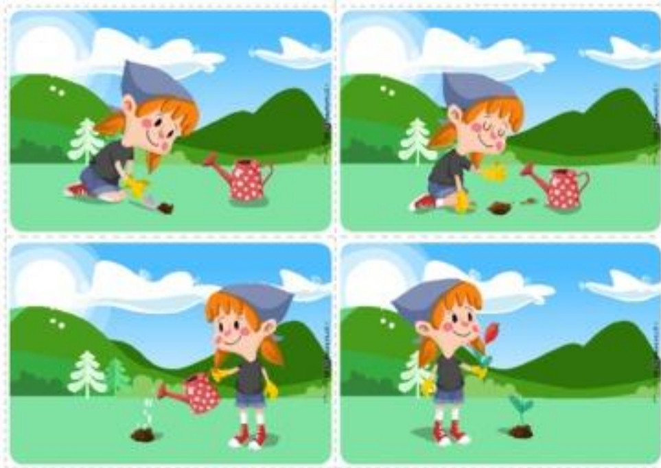
Historyjka obrazkowa ze strony printoteka.pl

4. Proszę, aby dziecko opowiedziało krótką historyjkę o tym, co robi dziewczynka ;